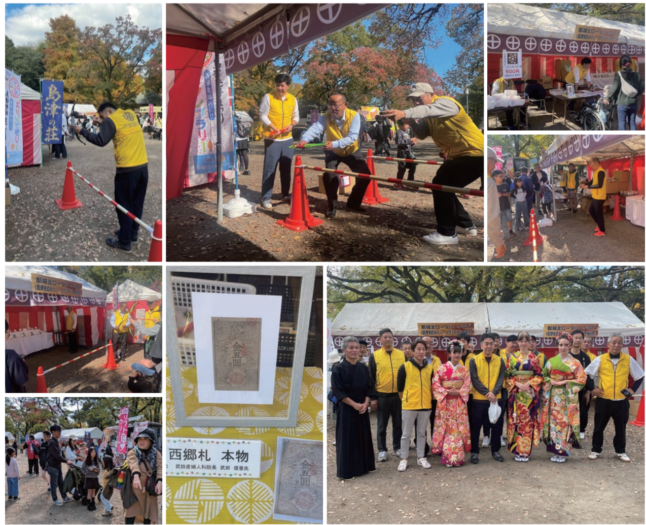
スタンプラリー抽選会